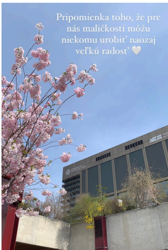
Vstup do AKH na jar

Prikladám pár fotiek (ospravedlňujem sa za horšiu kvalitu, ale kvôli zmene mobilu použijem fotky zo sociálnych sietí):