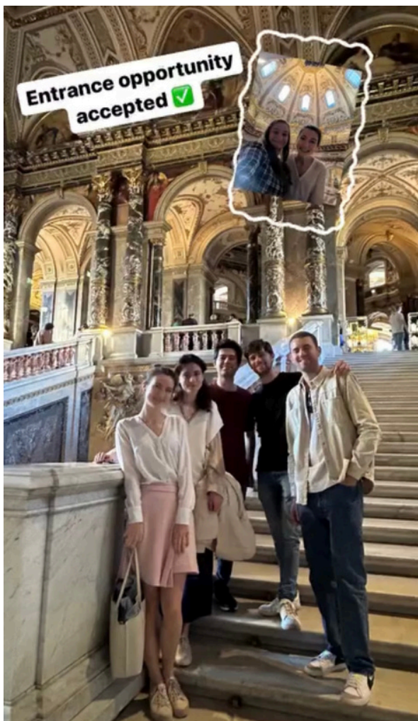
Kunsthistorisches Museum Wien