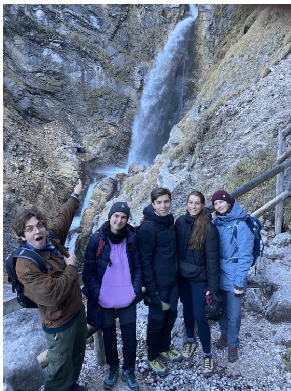
Hviezdna crew 2