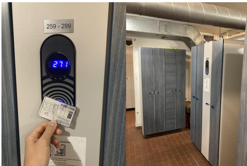
Skrinky pre študentov - priložíte študentskú kartu a skrinka sa vám otvorí