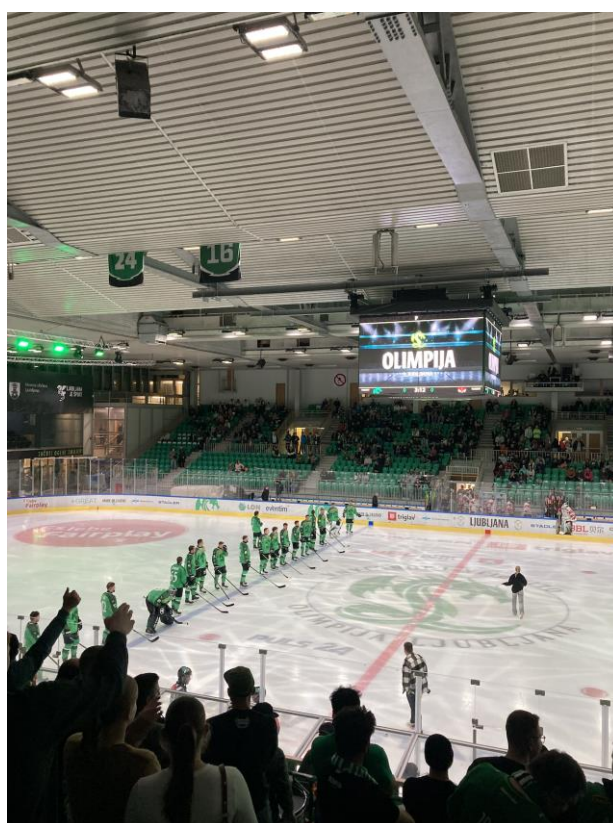
Hokejový zápas v Ljubljani – nič moc podívaná, prehrali 2:7 proti talianskemu Bolzanu