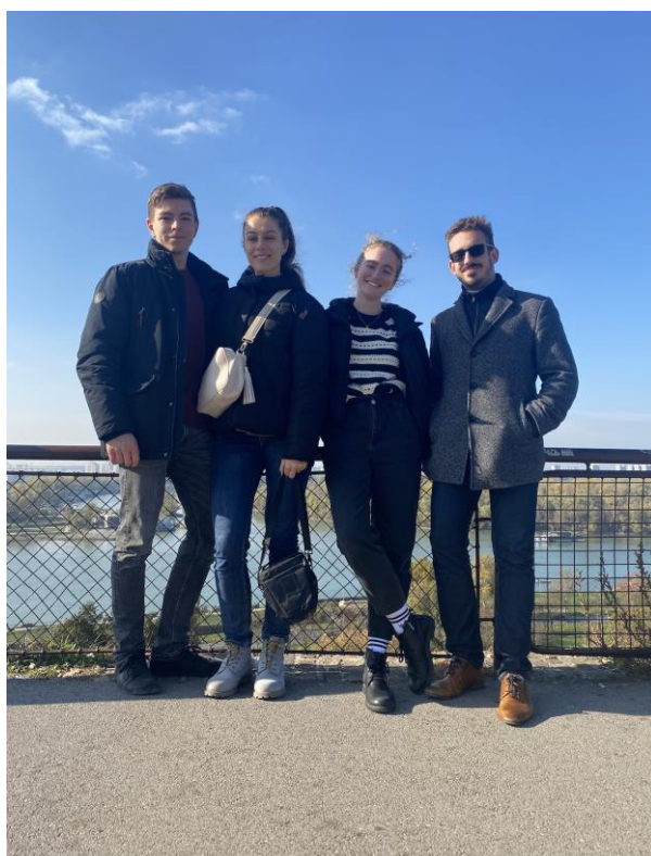
Hviezdna crew 1